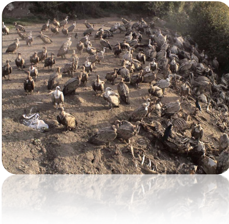
Видео-надзор у ресторану за белоглавог супа на Увцу није у функцији.

Током три деценије рада забележено је 1321 успешних гнежђења белоглавог супа у 208 гнезда у Србији. Обележено је крилним маркицама 219 младунаца, који су забележени 1712 пута а у 16 земаља са 648 опажања, међу којима су у највећем броју опажања из Израела, Бугарске и Грчке. Најдаље је отишао белоглави суп Алибаба до Јемена, на удаљеност од 3450 км. Птице из Србије бележене су у Француској, Италији, Мађарској, Естонији, Пољској, Турској и Саудиској Арабији поред земаља са Балкана, што је потврдило доминантан значај популације из Србији, првенствено за Балканско полуострво. Достигнути стандарди у раду су омогућили планирање програма расељавања белоглавог супа на просторе са којих се повукао у нашој земљи и конкурисање за европске пројекте. Без подршке државе није могуће да се реализује програм којим Србија враћа белоглавог супа у Републику Српску. Програм мониторинга белоглавог супа у Србији последње 4 године нема финансијску подршку државе, што је утицало да се постепено гасе примењене мере заштите и доведе у питање могућност успешног реализовања програма насељавања белоглавог супа у Републику Српску.