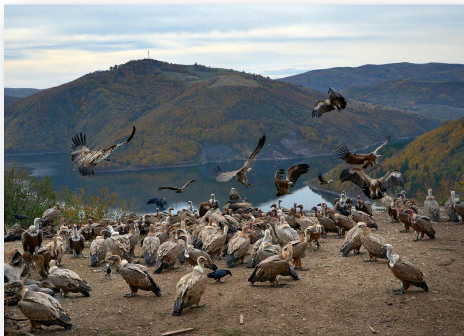
Ресторан за супове Увац Фото С. Прерадовић.

За реализовање програм заштите и расељавања белоглавог супа неопходно је враћање стандарда контроле популације који су били у пракси до 2011. године. Враћање Центру за заштиту птица грабљивица у првобитно стање и стављање безбедне клопке у функцију. За успешно конкурисање на Европски LIFE пројекат неопходно је уређивање заштићеног природног добра у циљу успостављање европских стандарда у којима поред контроле популације угрожене врсте мора да се развија и образовни садржај. Подршка програма Повратак белоглавог супа на Попово поље у Херцеговину и улагање Републике Српске нема даљег смисла ако се не уреди однос према мониторингу популације у Србији.